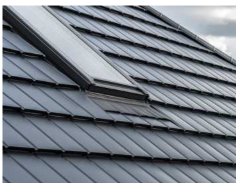
ZPLUS+ MODULÁRIS CSEREPESLEMEZ