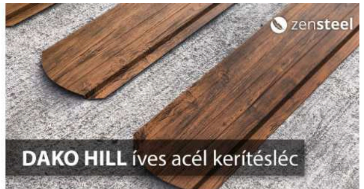
DAKO HILL ÍVES ACÉL KERÍTÉSLENC