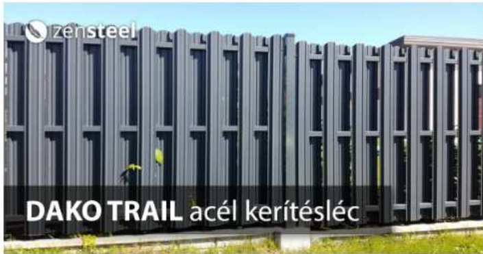
DAKO TRAIL ACÉL KERÍTÉSLENC