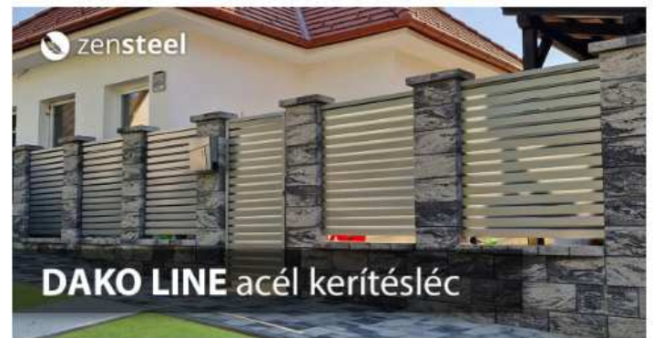
DAKO LINE ACÉL KERÍTÉSLENC